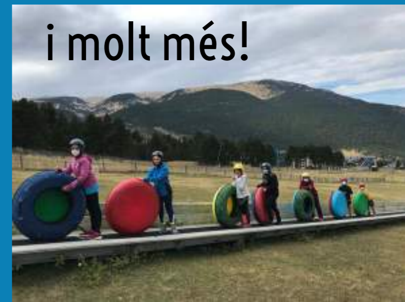
i molt més!